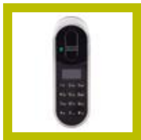
Lecteur Touchpad+ (code et empreinte digitale)