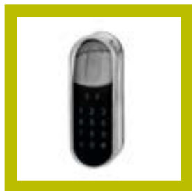
Lecteur Touchpad (code)